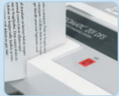
Im Size-Selector wird die passende Mappengröße bestimmt