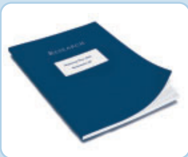
Individuell gestaltete Mappe – Design nach Ihren Vorstellungen