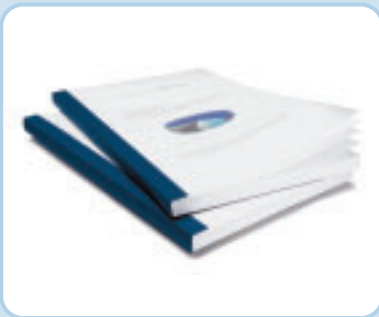
Standardmappen – hier in der Ausführung Aquarelle