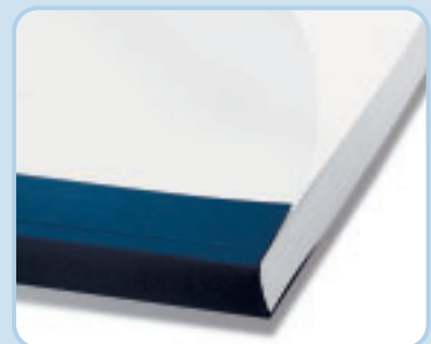
Gebundene Bindomatic-Mappe mit akkurat ausgerichtetem Papier und sauberer Rückenkontur