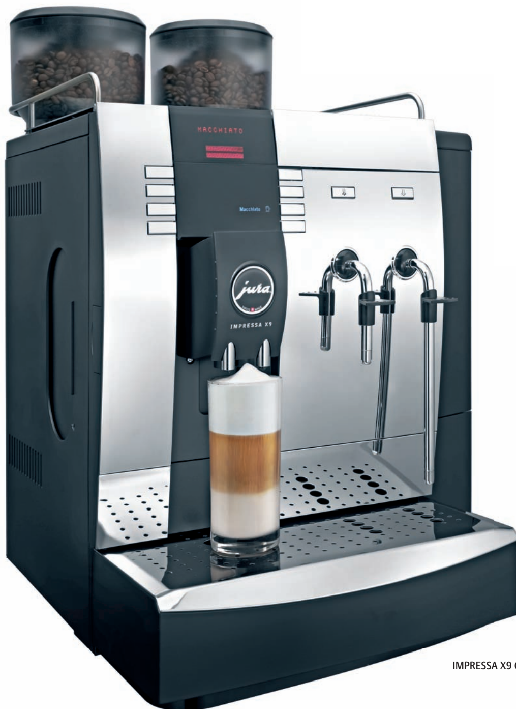
IMPRESSA X9 Chrom