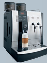
IMPRESSA X9 Platin