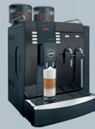
IMPRESSA X9 Pianoblack