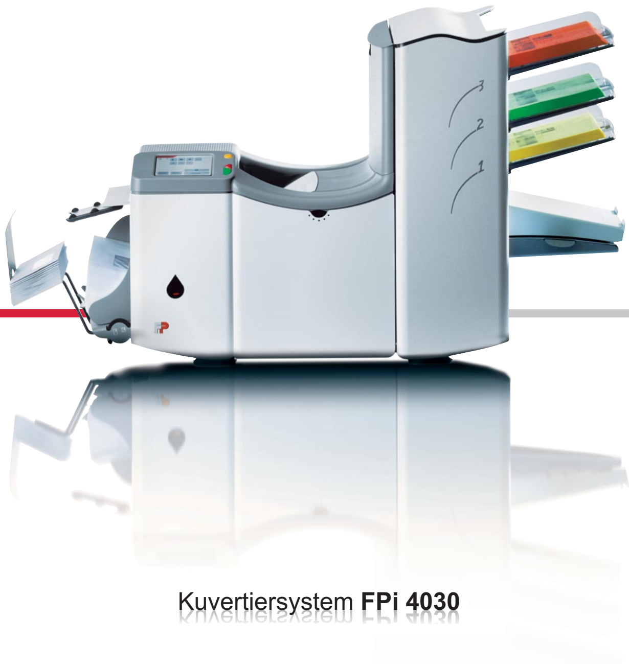
Kuvertiersystem FPI 4030

Die professionelle Kuvertierlösung für mittlere Postaufkommen.