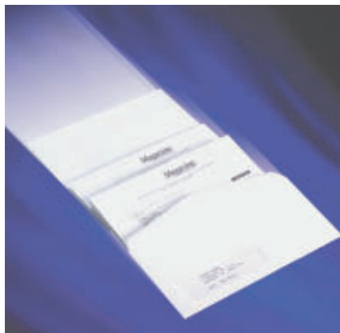
Unterschiedliche Anwendungen: Tagespost, Mailings, Geschäftsbriefe. Falzt und kuvertiert zwei unterschiedliche A4 Blätter in einen Umschlag in Sekundenschnelle. Mit dem Beilagenanleger ist es möglich, z. B. zusätzlich eine vorgefaltete Beilage zu kuvertieren.