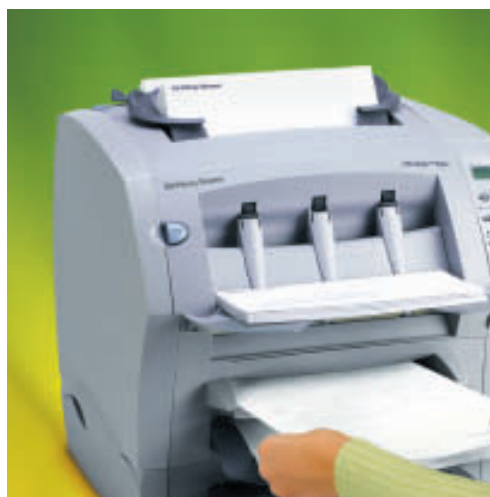
Bis zu 15 Briefe pro Minute. Der OfficeRight™ DI200 verarbeitet unterschiedliche Briefe und Dokumente, was immer Sie benötigen.