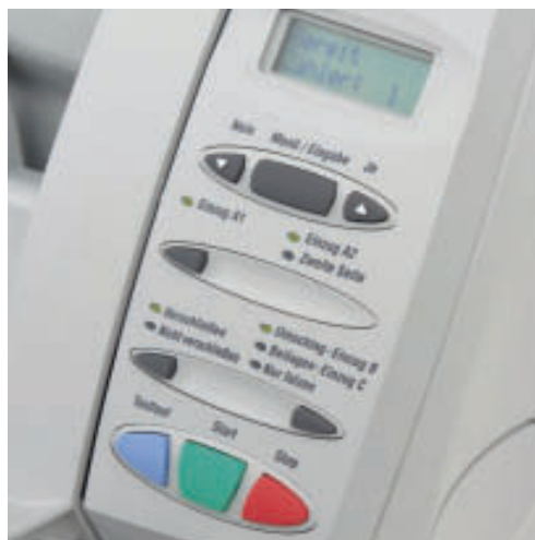
Einfache Bedienung, keine Jobprogrammierung notwendig. Alles funktioniert auf Tastendruck.

Verbesserte Produktivität – Handarbeit ist unnötig.